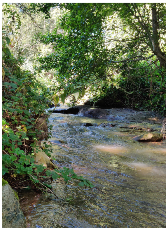
Le Lliscù à sa confluence avec la Têt à Eus