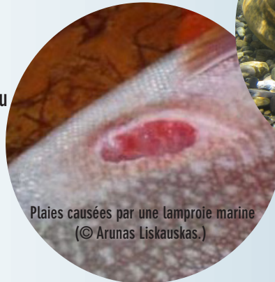
Plaies causées par une lamproïe marine

...les informations nous intéressent également !